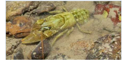
Ecrevisses à pattes blanches